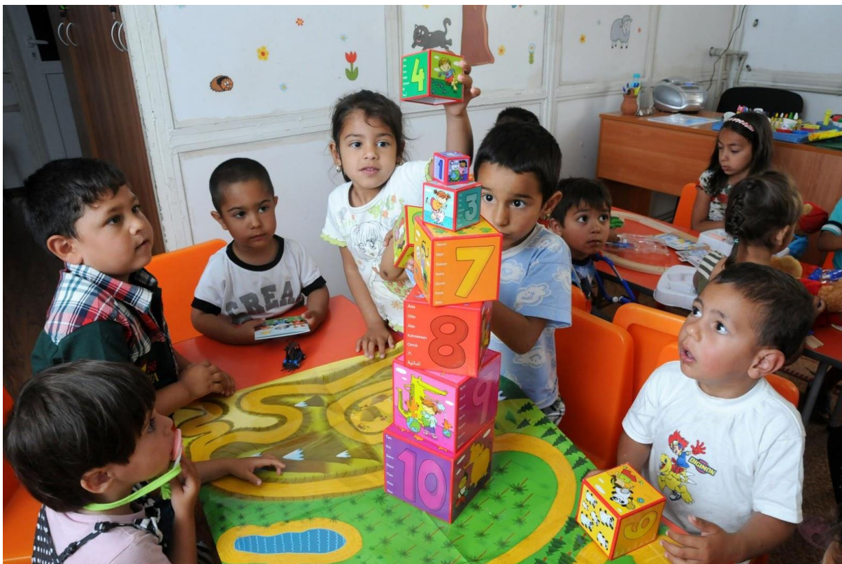
Снимка: Български деца играят със строител (Уницеф). 9